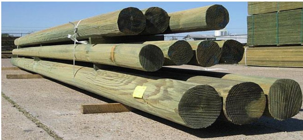
Kuva 2 Esimerkki CCA-kyllästetyistä puupylväistä (NPIC 2014.)

CCA-kyllästetty puu voidaan lisäksi luokitella käytöstä poistetun puumateriaalin eli kierrätyspuun luokkien mukaan A, B, C tai D VTT:n ohjeistuksen perusteella. Luokan A ja B puu kuuluvat puuperäisten biopolttoaineiden standardin SFS-EN ISO 177225-1 alle, missä A on puhdasta puumateriaalia ja luokka B kemiallisesti käsiteltyä puuta, joka ei sisällä orgaanisia halogenoituja yhdisteitä tai raskasmetalleja. Luokkaan C kuuluu orgaanisia halogenoituja yhdisteitä ja raskasmetalleja sisältävä puu, joka ei sisällä puunkyllästeaineita. C-luokan puun laatuvaatimukset määritellään kierrätyspolttoaineiden standardin SFS-EN 15359 sisällä. CCA-kyllästetyt sähköpylväät taas kuuluvat puunkyllästysaineilla käsitellynä puuna luokkaan D, joka on vaarallista jätettä. Esimerkin CCA-kyllästeillä käsitellyistä vihertävistä puupylväistä voi nähdä kuvassa 2. (VTT 2014.)